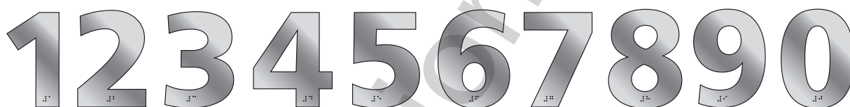
LIT 100 SS 1, 2, 3, 4, 5, ...