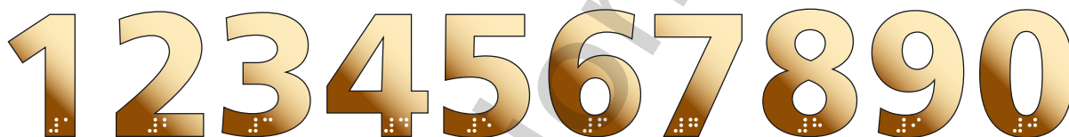
LIT 50 LP 1, 2, 3, 4, 5, ...