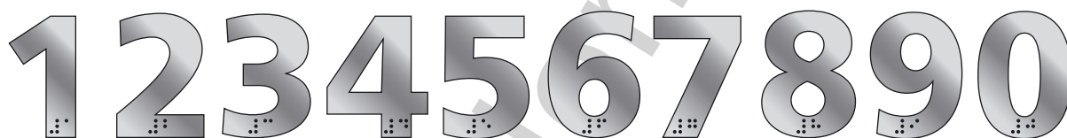
LIT 50 SS 1, 2, 3, 4, 5, ...