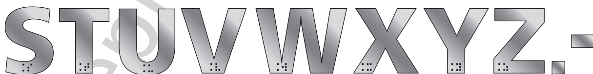
LIT 50 SS A, B, C, D, ...